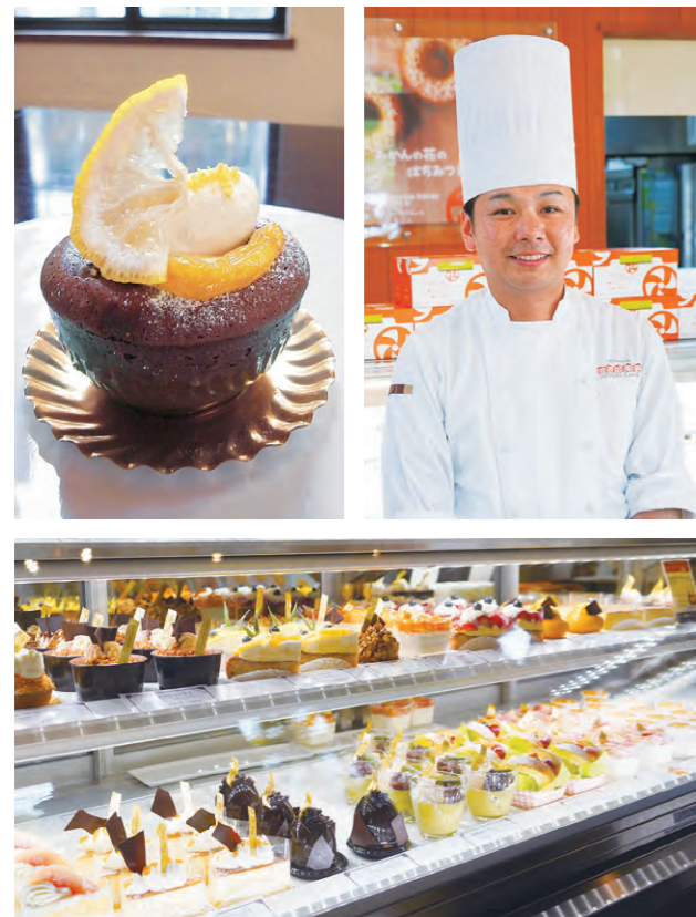
パティスリー ミカンカフェ 愛媛県松山市越智2-6-4 TEL:089-969-0876