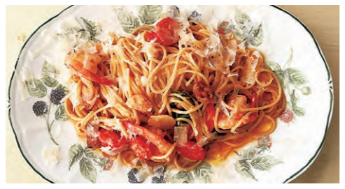
SLOW PROJECT 즐거운 식탁(楽しい食卓) 全羅南道順天市旺之洞881-1 TEL: +82-(0)61-723-0222