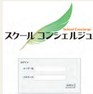
スクールコンシェルジュ