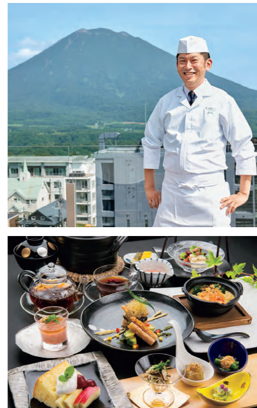
CHALET IVY(シャレーアイビー) 北海道虻田郡倶知安町字山田188-19 TEL:0136-22-1123