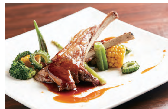
Base Cafe (ベースカフェ) 福岡県北九州市小倉北区浅野2-13-24 TEL:093-511-2070