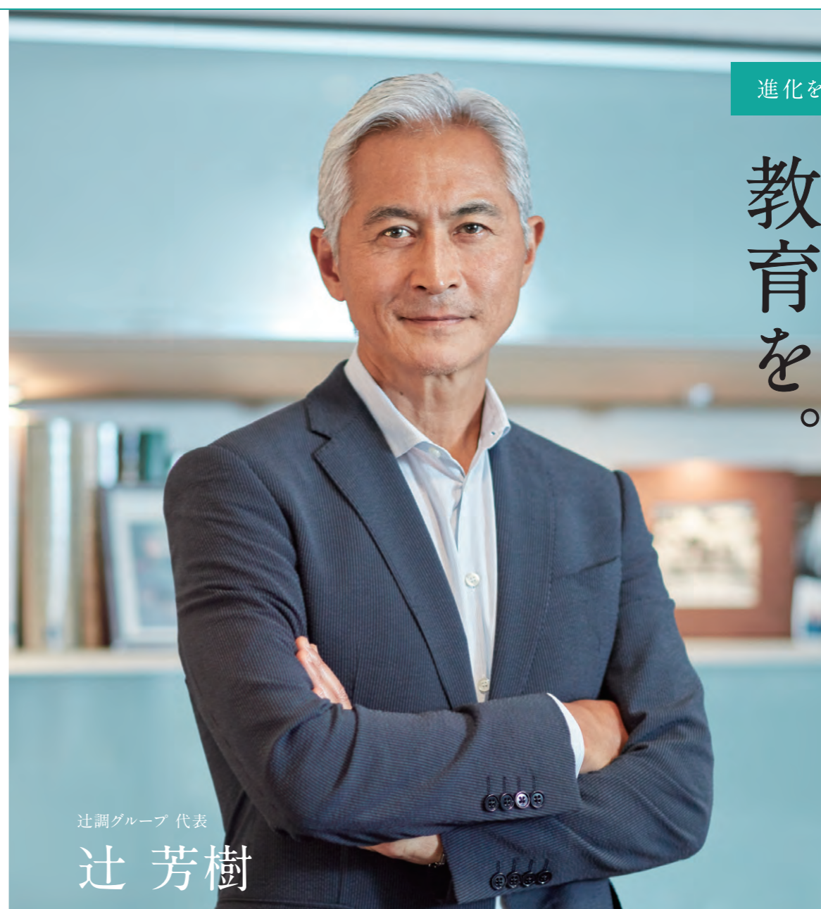
辻調グループ 代表